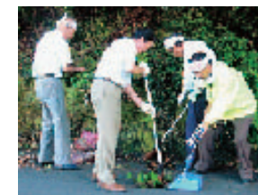
クリーンウォーキング