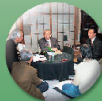
相愛会員宅での誌友会