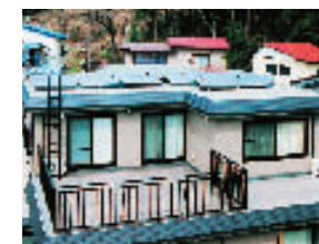
太陽光発電装置の設置