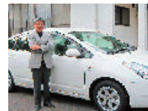
ハイブリッド車の利用